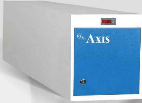
AX 135 / 135 Lt.