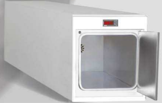
Door Lock System

Sterilize with confidence by Superior of Warm Sterilization at 54°C