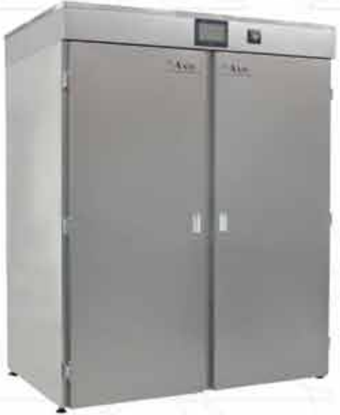
AX 4000 / 4000 Lt.