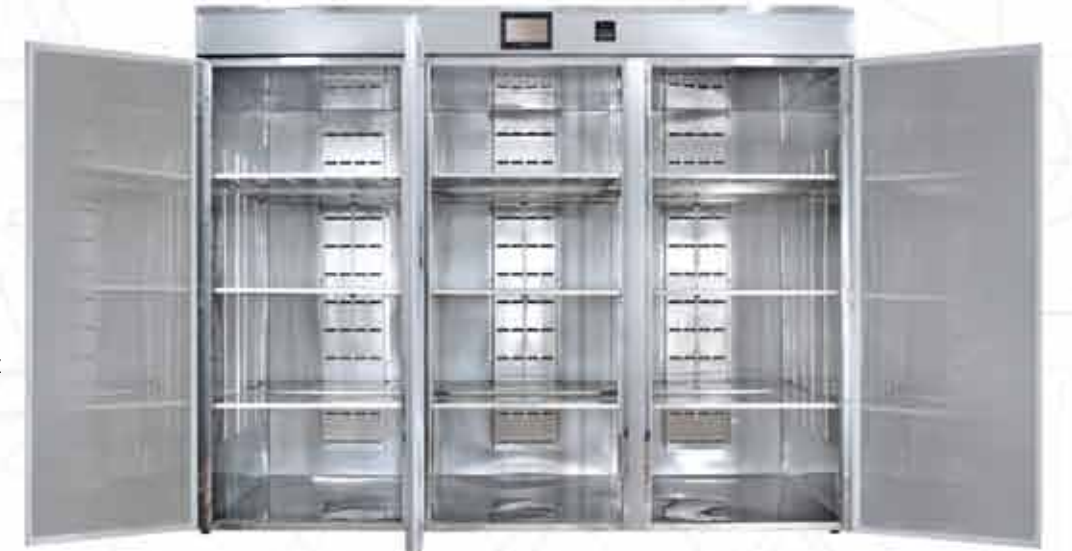
AX 6000 / 6000 Lt.