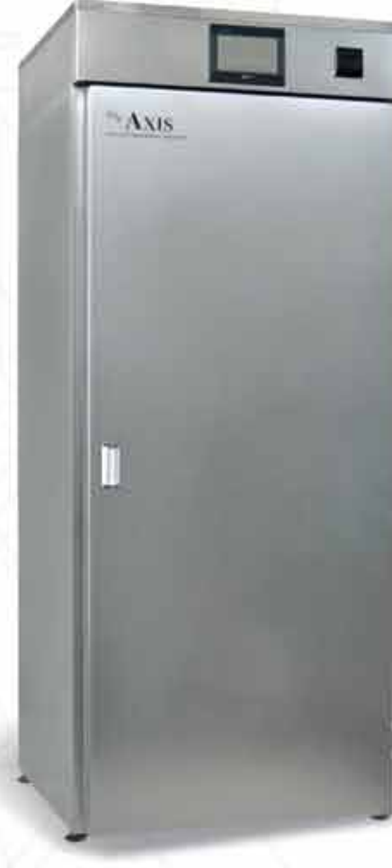
AX 1000 / 1000 Lt.

Kazan tip endüstriyel sterilizatörler için arayınız.