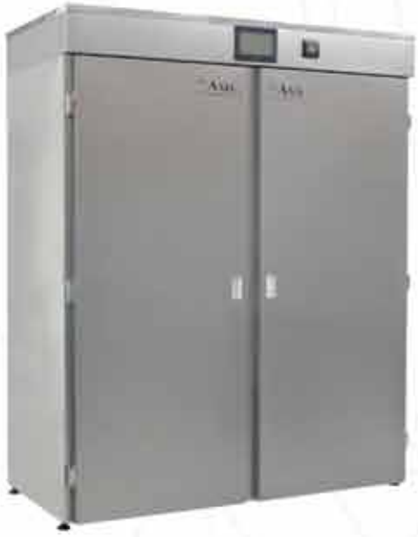
AX 2000 / 2000 Lt.